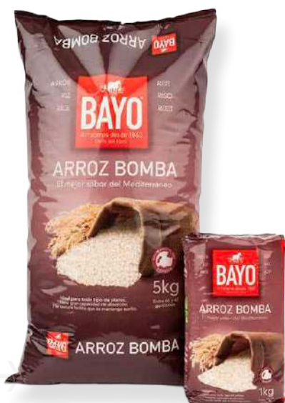
ref. 6258,7 6258,72 ARRÒS BOMBA BAYO (5kg. x 4u)(1kg. x 20u.).