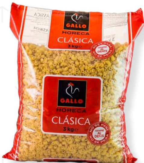
ref. 6386 TIBURON N° 0 GALLO (3kg.x 1u.)