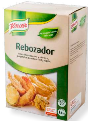
ref. 6887 TEMPURA ESPECIAL PER FREGIR KNORR (1,8kg. x 6u.)