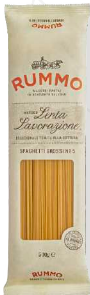
ref. 6437 SPAGUETTI N° 2 RUMMO (500gr.x 12u.)