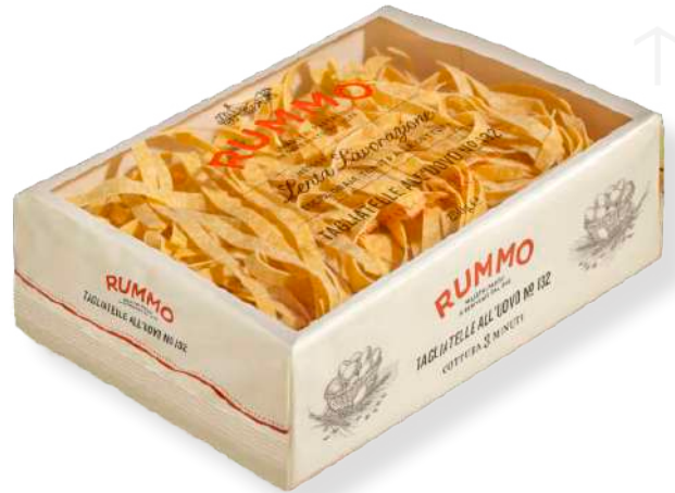
ref. 6434 PAPPARDELLE UOVO NIDI RUMMO (250gr.x 12u.)