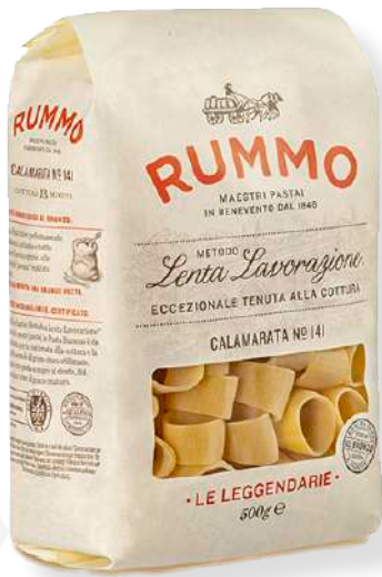
ref. 6432 CALAMARATA N° 141 RUMMO (500gr.x 12u.)