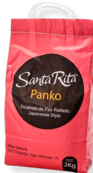
ref. 6373 PANKO (PA RATLLAT JAPONES) SANTA RITA (5kg.x 1u.)