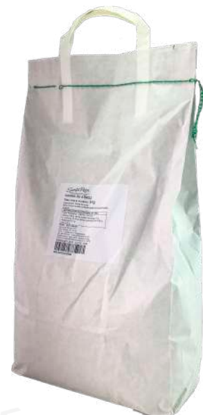
ref. 6326 FARINA DE D'ARRÒS SANTA RITA (5Kg.x 1u.)