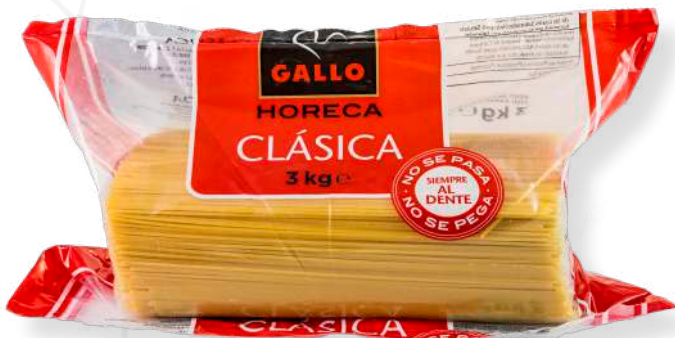
ref. 6385 ESPAGUETI N° 3 GALLO (3kg.x 1u.)