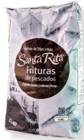
ref. 6328 FARINA ESPECIAL PER FREGIR SANTA RITA (5kg.x 1u.)