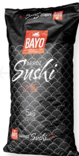
ref. 6264,3 ARRÒS SUSHI BAYO (5kg. x 4u.)