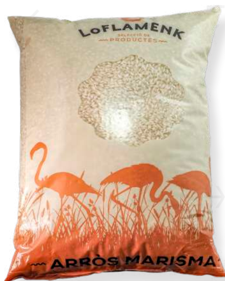
ref. 6264,4 ARRÒS MARISMA LO FLAMENK (CASTELLS) (5kg. x 4u.)