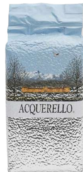
ref. 6268 ARRÒS CARNAROLI ACQUARELLO (2,5kg. x 4u.)