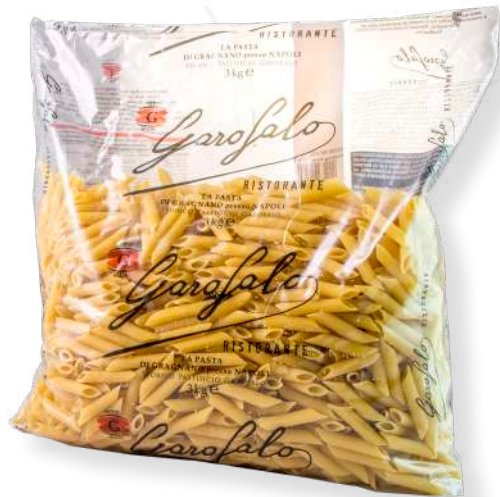
ref. 6420 PENNA ZITI RIGATE N° 70 GAROFALO (RISTORANTE) (3kg.x 4u.)