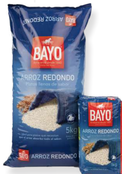
ref. 6253 ARRÒS RODÓ BAYO (5kg. x 4u)(1kg. x 20u.).