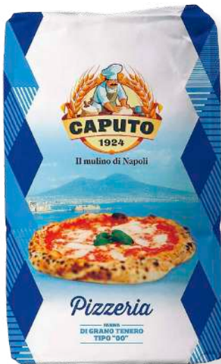
ref. 6320,4 FARINA PIZZERIA CAPUTO (25kg.x 1u.)