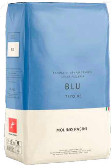
ref. 6320,5 FARINA BLU TIPO 00 MOLINO PASINI (25kg.x 1u.)