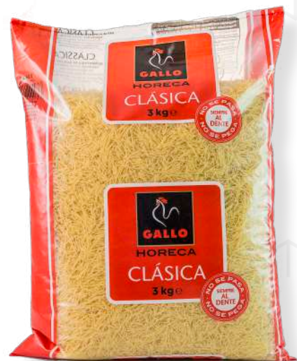
ref. 6340 FIDEU N° 0 GALLO (3kg.x 1u.)