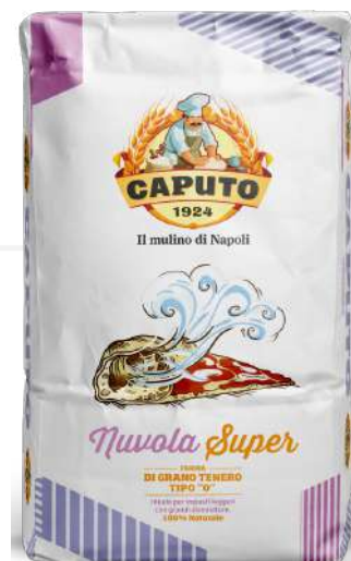
ref. 6320,7 FARINA NUVOLE SUPER CAPUTO (25kg.x 1u.)