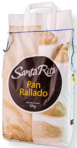
ref. 6372 PA RATLLAT SANTA RITA (5kg.x 1u.)