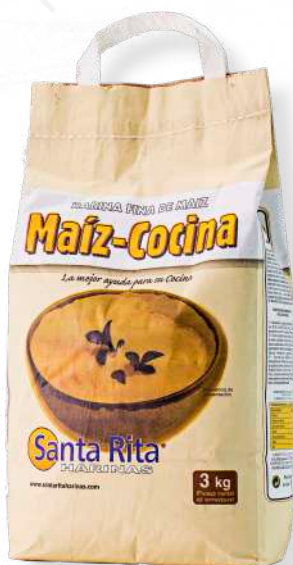
ref. 6865 FARINA DE PANÍS SANTA RITA (3kg.x 1u.)