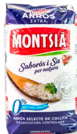
ref. 6260 ARRÒS MONTSIÀ (1kg. x 10u.)