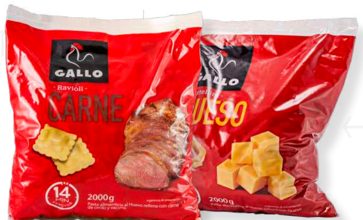
ref. 6400 RAVIOLI DE CARN GALLO (2kg.x 1u.)