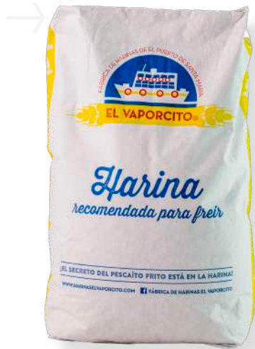
ref. 6323 FARINA ESPECIAL PER FREGIR EL VAPORCITO (5kg.x 1u.)