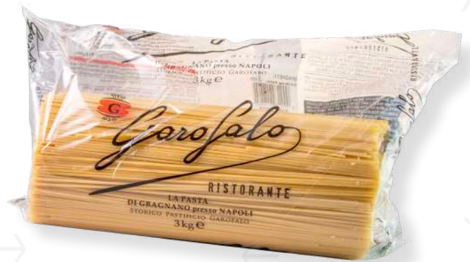
ref. 642i ESPAGUETI N° 9 GAROFALO (RISTORANTE) (3kg.x 4u.)