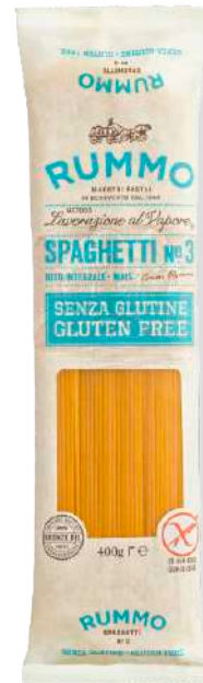
ref. 6438,2 SPAGUETTI SENSE GLUTINE RUMMO (400gr.x 12u.)