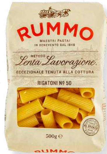
ref. 6436 RIGATONI RUMMO (500gr.x 16u.)