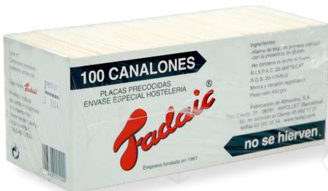
ref. 6265 PASTA PER CANELONS FADAIC (100u./caixa)