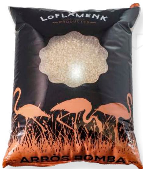
ref. 6258,6 ARRÒS BOMBA LO FLAMENK (CASTELLS) (5kg. x 4u.)