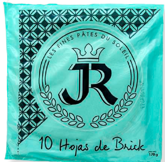
ref. 6318 PASTA BRIK JR (25 bosses de 10 fulls)