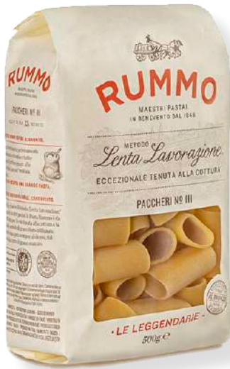
ref. 6433,8 PACHERI LISCE N°111 RUMMO (500gr.x 12u.)