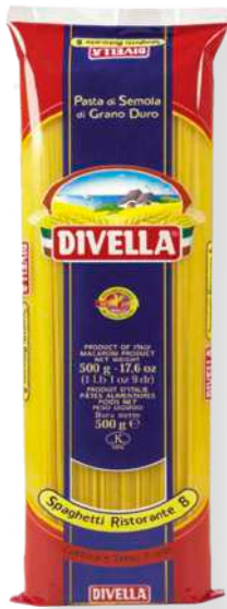
ref. 6437,2 SPAGUETTI N°8 DIVELLA (500gr. x 36u.)