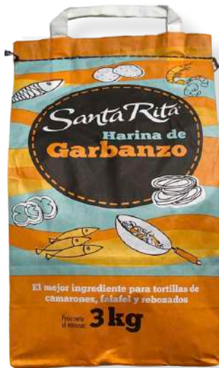
ref. 6329 FARINA DE SIGRÓ SANTA RITA (3Kg.x 1u.)