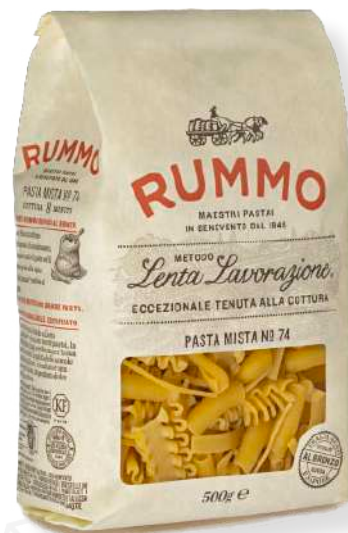
ref. 6434,4 PASTA MISTA RUMMO (500gr.x 16u.)