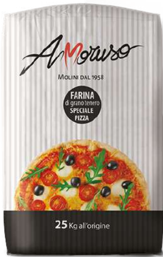
ref. 6321,2 FARINA SPECIALE PIZZA AMORUSO (25kg.x 1u.)