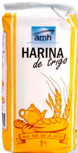
ref. 6325,5 FARINA DE BLAT AMH (1kg.x 12u.)