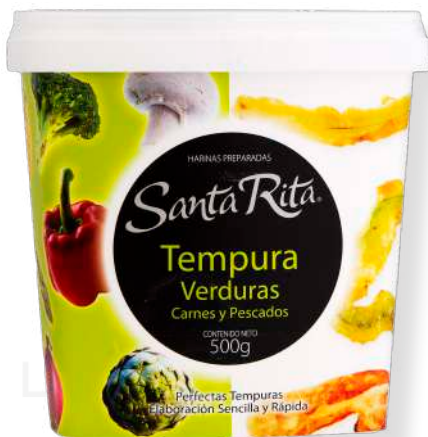
ref. 6320 TEMPURA ESPECIAL PER FREGIR SANTA RITA (500g.x 12u.)