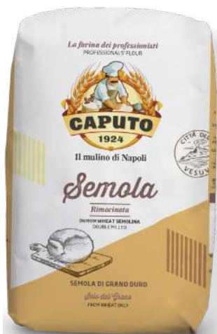
ref. 6320,9 SEMOLA RIMACINATA CAPUTO (5kg.x 1u.)