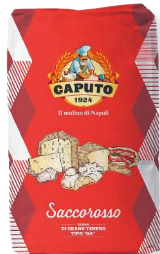
ref. 6320,6 FARINA SACCOROSSO CAPUTO (25kg.x 1u.)