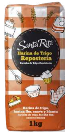
ref. 6325 FARINA REPOSTERIA SANTA RITA (1kg. x 12u.)