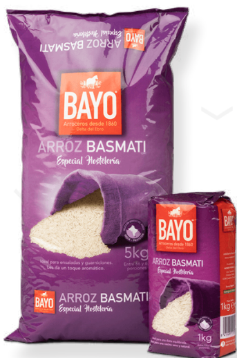
ref. 6264,5 ARRÒS BASMATI BAYO (5kg. x 4u)(1kg. x 20u.).