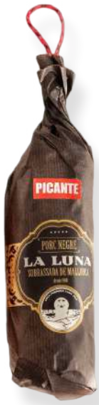
ref.2802,2 SOBRASSADA DE PORC NEGRE PICANT LA LUNA(±500gr. x 6kg.)