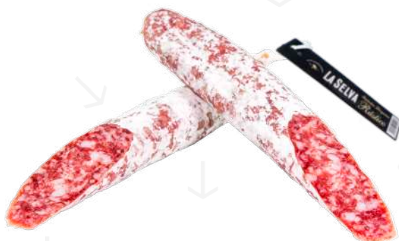
ref.2386 SOMALLA EXTRA 60CM. LA SELVA (0,5kg. x 2u.)