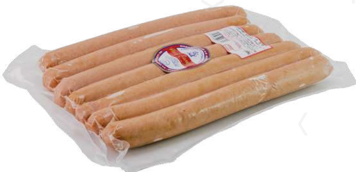
ref.2717 FRANKFURT 26 CM MAX ZANDER (1kg. x 6u.)