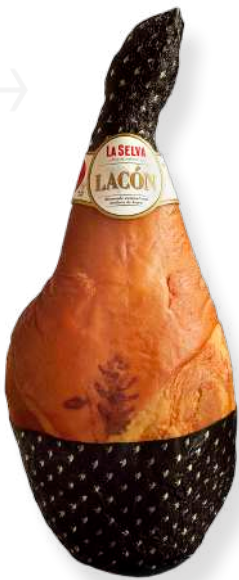
ref.2059 LACÓN CUIT I FUMAT LA SELVA (6kg. x 1u.)