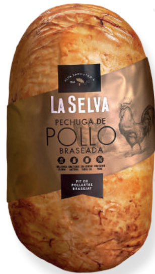
ref.2065 PIT DE POLLASTRE BRASEJAT LA SELVA (2,15kg. x 1u.)