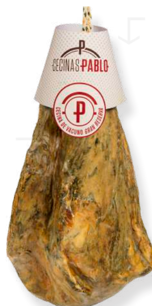
ref.2190 TAPA CECINA PABLO (2,75kg. x 2u.)