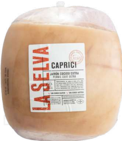
ref.2015 PERNIL CUIT CAPRICI LA SELVA (7kg. x 1u.)