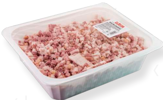
ref.2292,5 DAUS DE BACON S/COTNA- TENDRUM GALA LA SELVA (2kg. x 2u.)