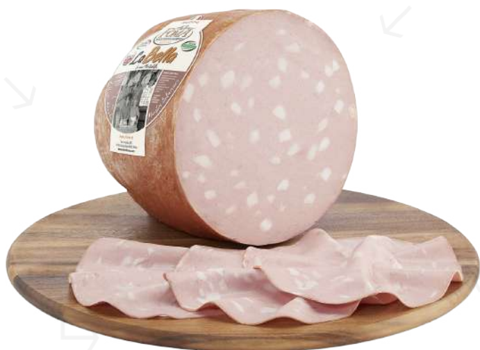
ref.2228 MORTADEL-LA LA BELLA ANTICA FOMA (6,5kg. x 1u.)