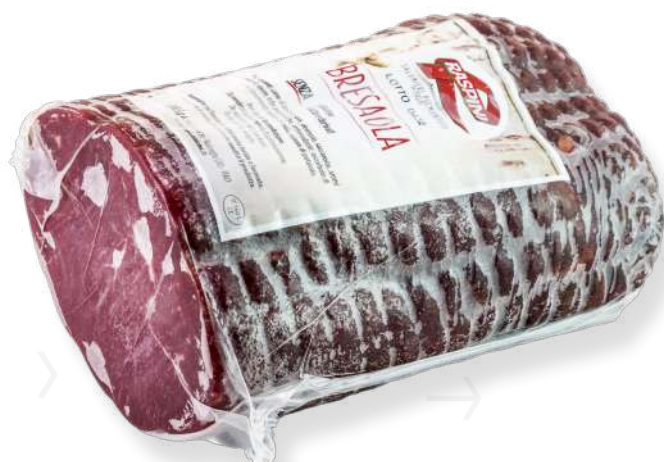
ref.2193 BREASOLA SOTTOFESA FIORUCCI (2,5kg. x 2u.)