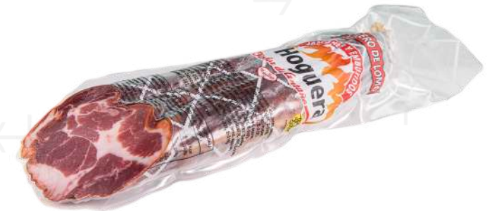
ref.2519 CAP DE LLOM LA HOGUERA (1kg. x 5u.)