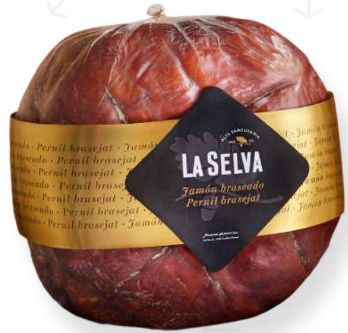
ref.2010 PERNIL CUIT EXTRA BASEJAT LA SELVA (7kg. x 1u.)