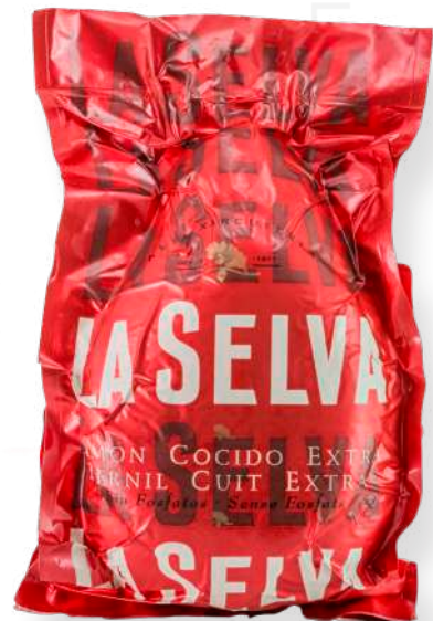
ref.2019 PERNIL CUIT EXTRA S/FOFATS ALUMINI LA SELVA (7kg. x 1u.)