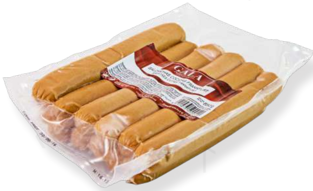
ref.2712 FRANKFURT GALA LA SELVA (12u. x 6u.)