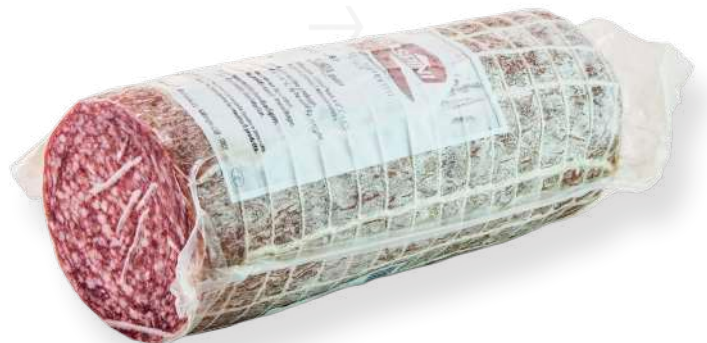
ref.2400 SALAMI MILANO 1/2 PEÇA RASPINI (1,5kg. x 6u.)