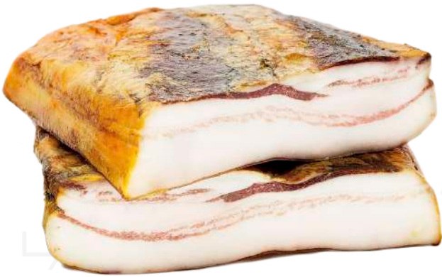
ref.2282 VENTRESCA FUMADA IBÈRICA DE GLÀ CASALBA (2,5kg. x 4u.)