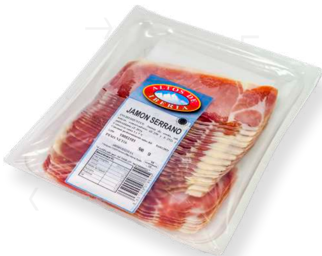
ref.2196 LLESQUES PERNIL SERRÀ CURAT MONTENEVADO (500gr. x 5u.)