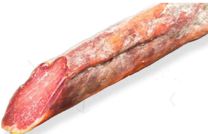
ref.2510 LLOM IBERIC "CEBO" LEONCIO (1kg. x 6u.)