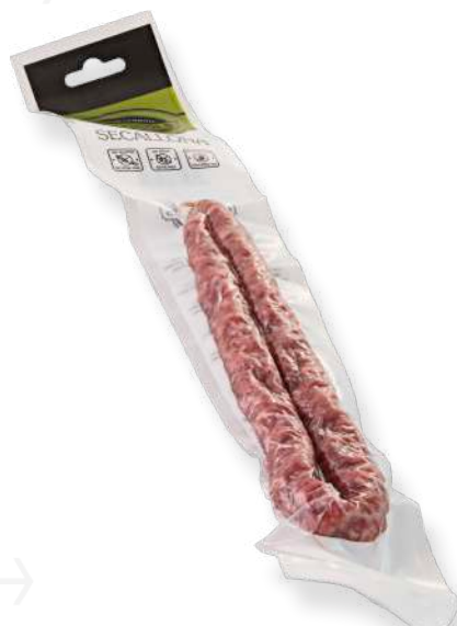
ref.2367 SECALLONA PRIMA FIGOLS (110gr. x 20u.)