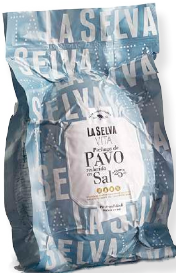
ref.2057 PIT DE DALL DINDI REDUIT AMB SAL LA SELVA (3,1kg. x 1u.)