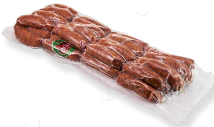
ref.2444 XORIÇ FRESC DOLÇ HNOS. BRICIO (2kg. x 3u.)