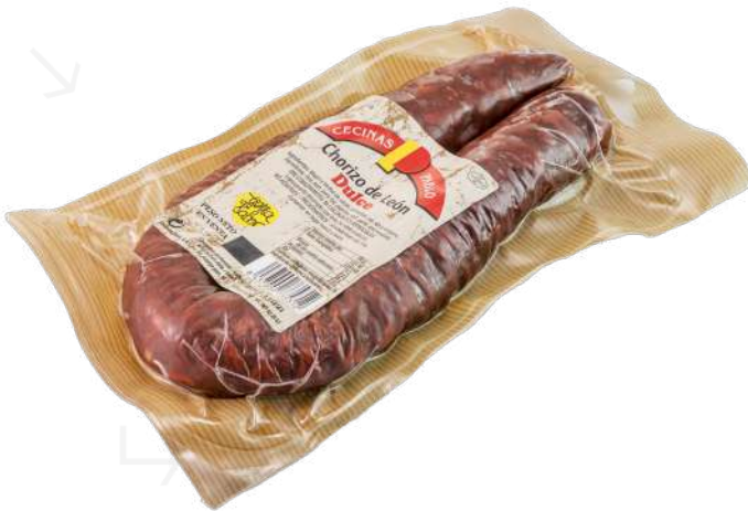
ref.2424 XORIÇ DE LEON DOLÇ CECINAS PABLO (500gr. x 16u.)