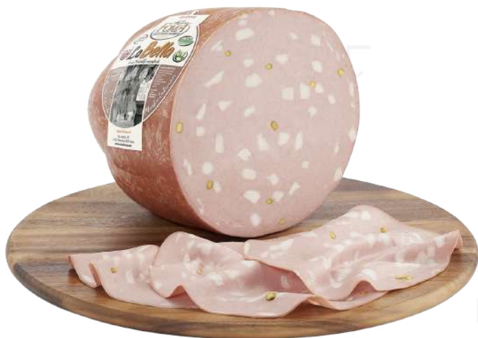
ref.2236,6 MORTADEL-LA LA BELLA CON PISTACCHI ANTICA FOMA (6kg. x 1u.)