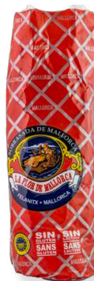
ref.2810 SOBRASSADA ARTESANAL SELECTA LA FLOR DE MALLORCA (± 800gr. x 3kg.)