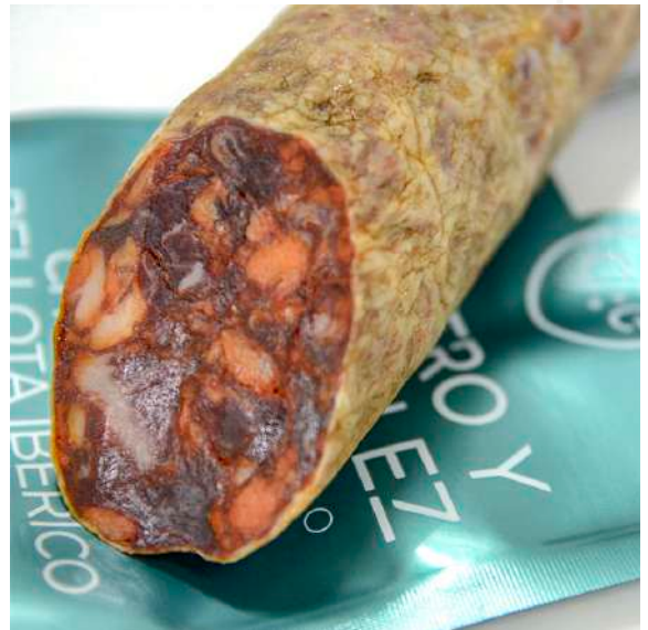
ref.2318 XORIÇ IBÈRIC DE GLÀ CASTRO & GONZALEZ (1kg. x 6u.)