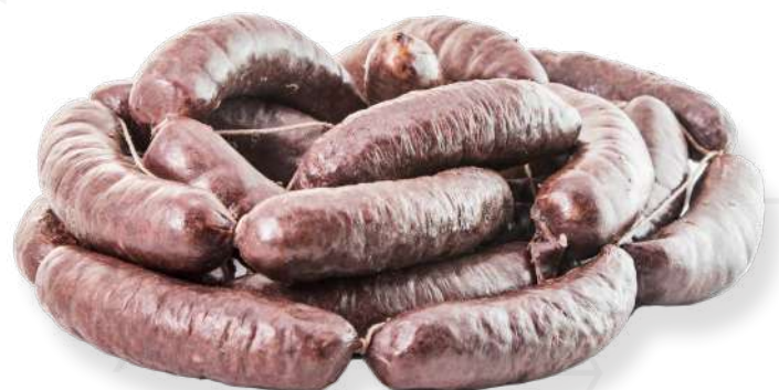
ref.2226 BALDANA D'ARRÒS DEL DELTA CURTO XARCUTERS (2kg. x 1u.)