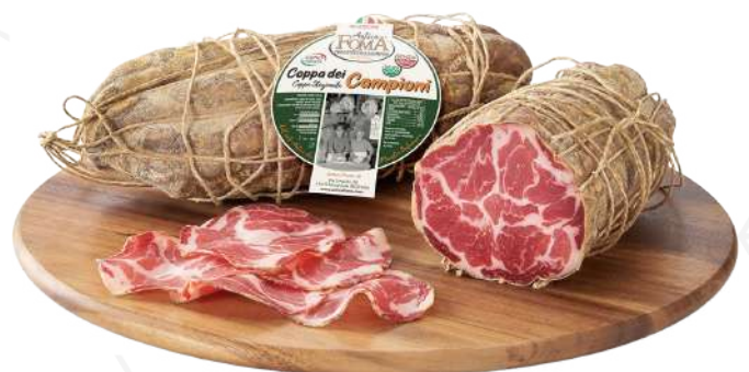
ref.2280,6 PEPINO IL GUANCILINO ANTICA FOMA (2,7kg. x 1u.)