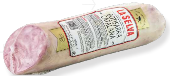
ref.2214 BOTIFARRA CATALANA 1/2 PEÇA LA SELVA (0,6kg. x 1u.)