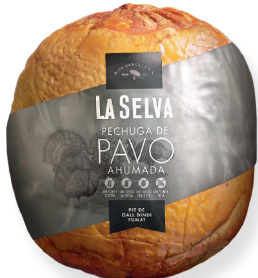
ref.2049 PIT DE DALL DINDI FUMAT LA SELVA (3,5kg. x 1u.)