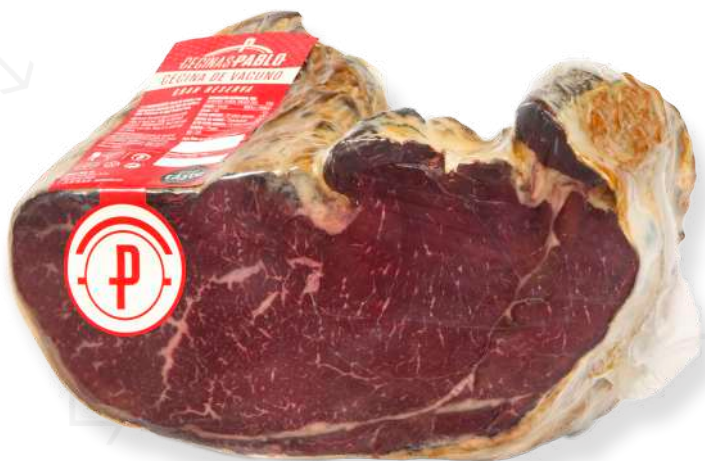
ref.2191 CECINA 1/2 PEÇA PABLO (7kg. x 2u.)