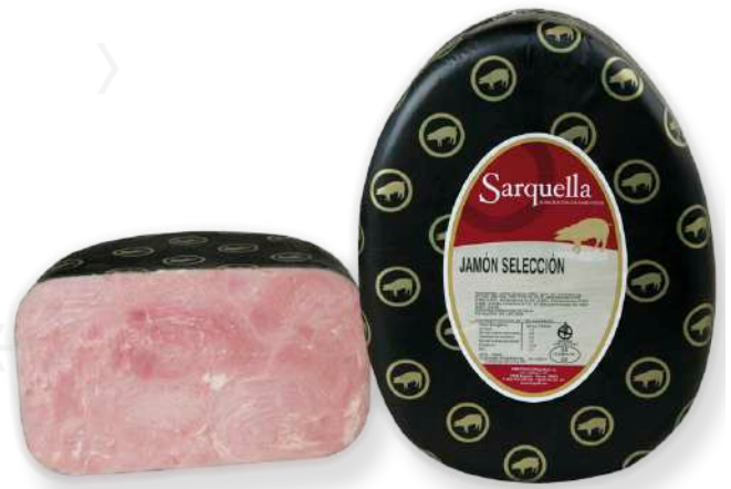
ref.2045 PERNIL CUIT SELECCIÓ SARQUELLA (7kg. x 1u.)