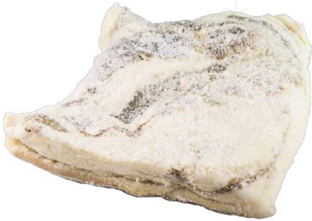
ref.2279 VENTRESCA IBÈRICA SANCHEZ ROMERO I CARVAJAL (25kg. x caixa.)