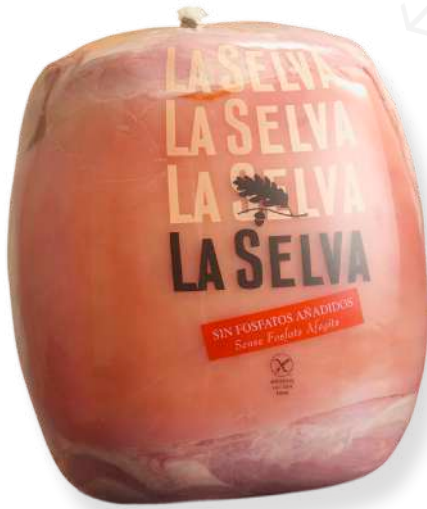
ref.2028 PERNIL CUIT EXTRA BUFFET S/FOFATS LA SELVA (7kg. x 1u.)