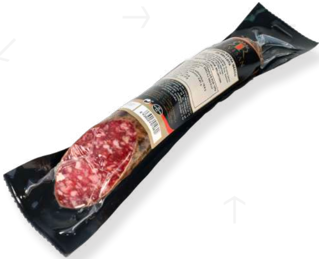
ref.2313,2 SALSITXO IBÈRIC DE GLÀ ÚNIC REVISAN (1,2kg. x 3u.)