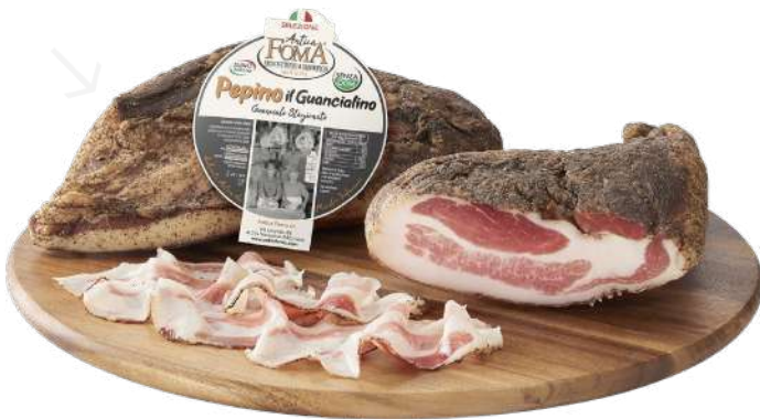
ref.2280,6 PEPINO IL GUANCILINO ANTICA FOMA (2,7kg. x 1u.)