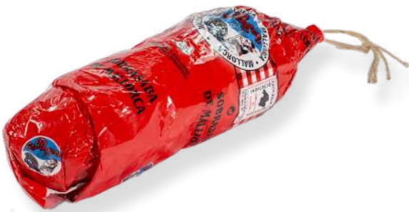
ref.2808 SOBRASSADA ARTESANAL "POLTRUS" ES PAGES (± 500gr. x 6kg.)