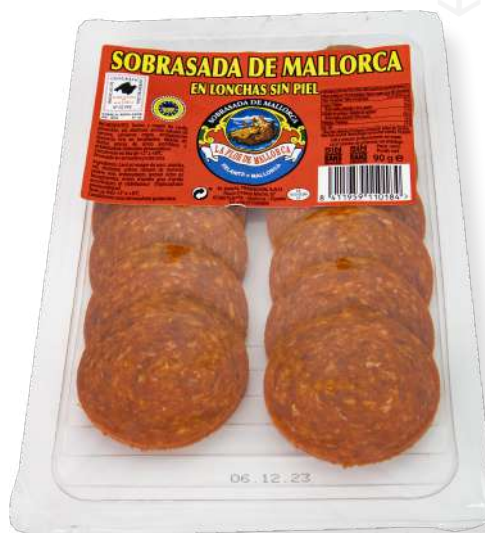
ref.2812 LLESQUES DE SOBRASSADA LA FLOR DE MALLORCA (90gr. x 12u.)