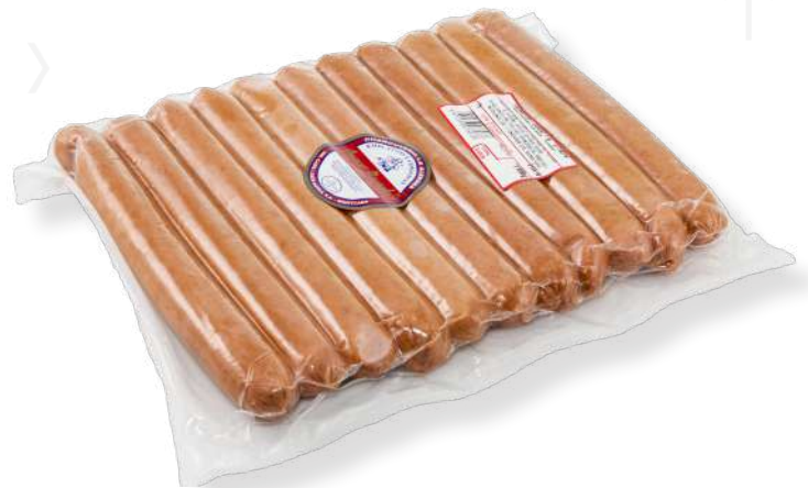
ref.2716 FRANKFURT 21CM MAX ZANDER (1,1kg. x 5u.)