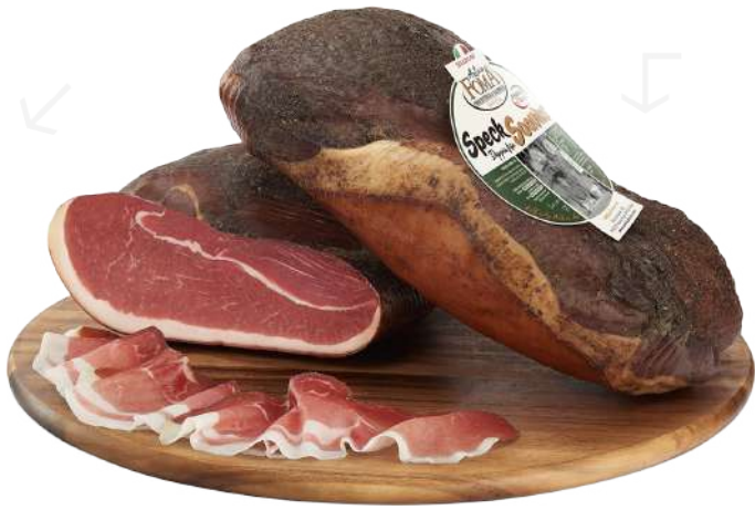
ref.2193,5 SPECK SOAVIUS ANTICA FOMA (5kg. x 1u.)