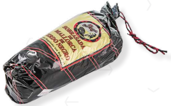
ref.2800 SOBRASSADA DE PORC NEGRE ES PAGES (800/1.000gr. x 6kg.)