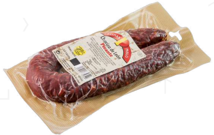
ref.2425 XORIÇ DE LEON PICANT CECINAS PABLO (500gr. x 16u.)