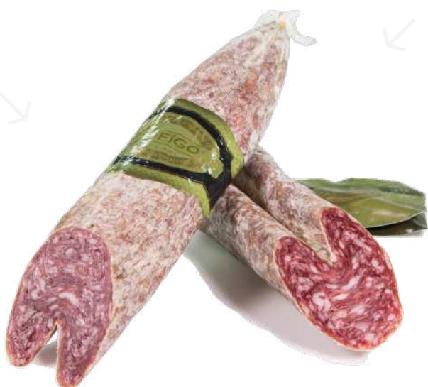
ref.2358 LLONGANISSA CELLER FIGOLS (1kg. x 3u.)