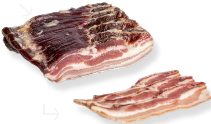
ref.2278 BACON NATURAL 1/2 CASA NOGUERA (1,5kg. x 6u.)