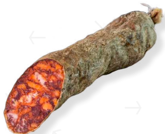
ref.2422 XORIÇ DE CAMPANYA SELECCIÓ LEONCIO (1kg. x 6u.)