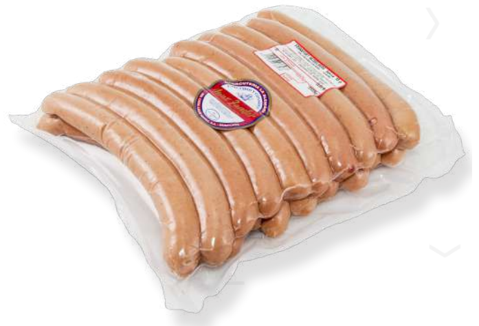
ref.2714 FRANKFURT HEIDELBERG MAX ZANDER (1,5kg. x 8u.)