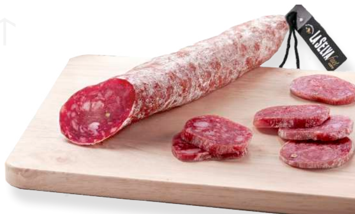
ref.2389 FUET EXTRA LA SELVA (175gr. x 16u.)