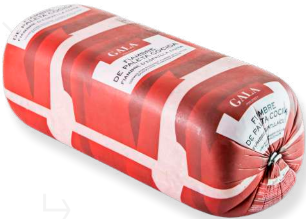
ref.2070 FIAMBRE BARRA II LA SELVA (3,5kg. x 2u.)