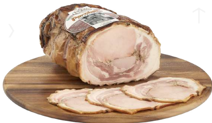
ref.2035 TRONCHETTO DI PORCHETTA ARROSSO ANTICA FOMA (5kg. x 1u.)