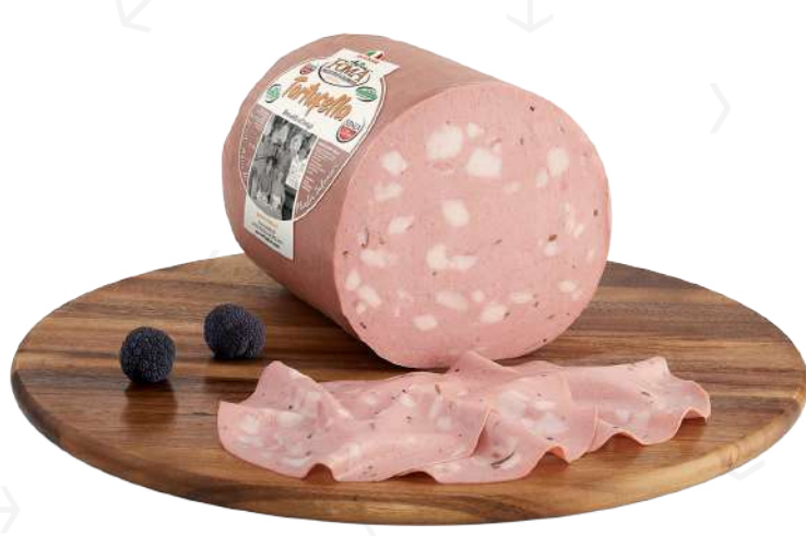
ref.2236,5 MORTADEL-LA TARTUFELLA ANTICA FOMA (6kg. x 1u.)