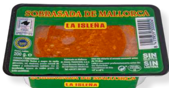
ref.2822 TARRINA DE SOBRASSADA LA ISLEÑA (200gr. x 12u.)