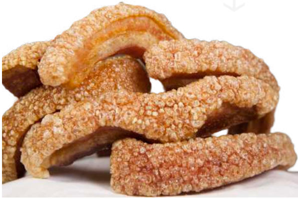
ref.2284 TORREZNO PRECUINAT DUROC FRISORIA (1,5kg. x 5u.)