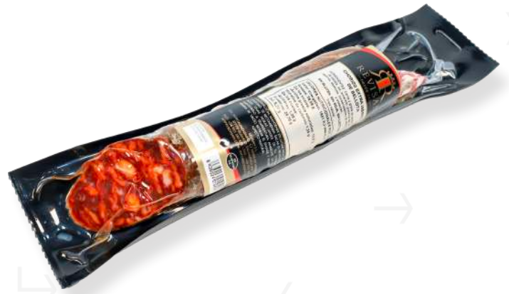
ref.2317 SALSITXO IBÈRIC DE GLÀ REVISAN (1,2kg. x 3u.)