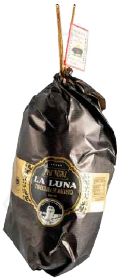
ref.2802 SOBRASSADA DE PORC NEGRE LA LUNA (±500gr. x 6kg.)