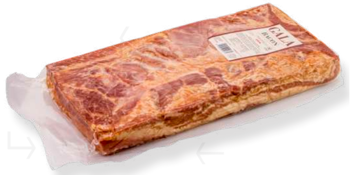
ref.2297 BACON MOTLE S/COTNA I TENDRUM LA SELVA (3,5kg. x 2u.)