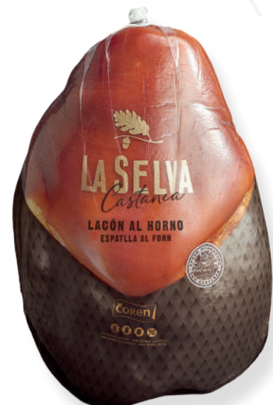
ref.2059,2 ESPATLLA AL FORN CASTANEA LA SELVA (4,75kg. x 1u.)