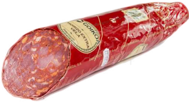
ref.2436 XORIÇ EXTRA "VELA" DOLÇ GOIKOA (1,75kg. x 2u.)