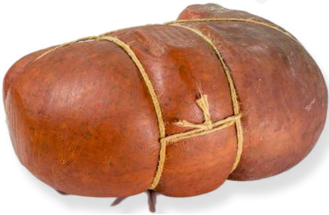
ref.2807 SOBRASSADA GEGANT ES PAGES (± 5kg.)