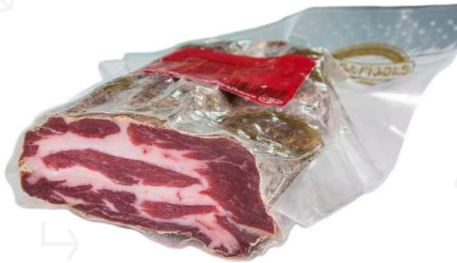
ref.2518 CAP DE LLOM 1/2 PEÇA CASA FIGOLS (300gr. x 8u.)