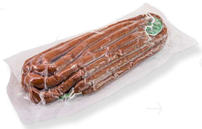
ref.2443 XISTORRA DOLÇA HNOS. BRICIO (2kg. x 3u.)