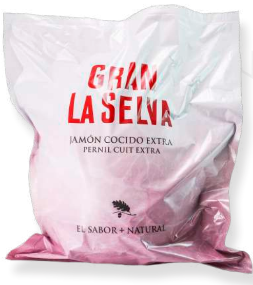
ref.2008 PERNIL CUIT EXTRA GRAN DUROC LA SELVA (8,5kg. x 1u.)