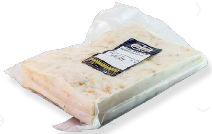
ref.2281 VENTRESCA IBÈRICA JULIAN MARTIN (1,5kg. x 4u.)