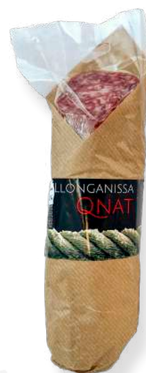
ref.2357,8 LLONGANISSA PAGES PORCIONADA QNAT (±250gr. x 16u.)