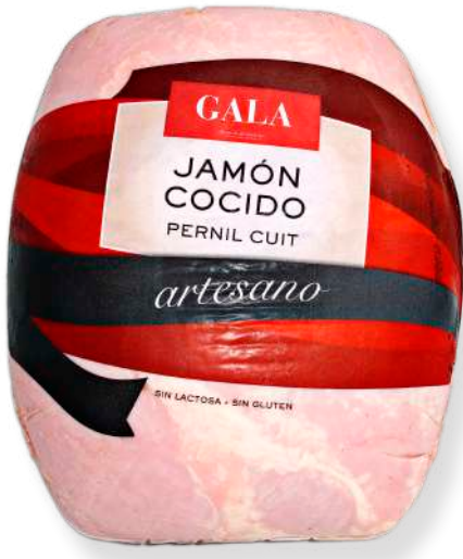
ref.2042 PERNIL CUIT EXTRA ARTESA LA SELVA (7kg. x 1u.)