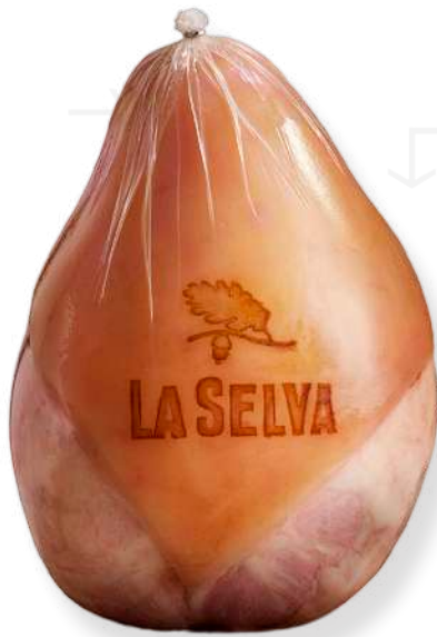
ref.2018 PERNIL CUIT EXTRA LA SELVA (7kg. x 1u.)