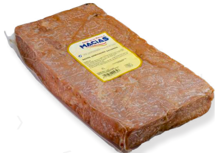
ref.2291 BACON MOTLLE MACIAS (4kg. x 2u.)