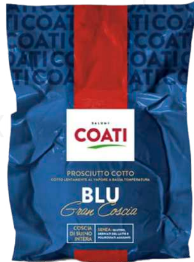
ref.2037 PROSCIUTTO COTTO DELLO CHEF 1/2 FIORUCCI (3,5kg. x 4u.)