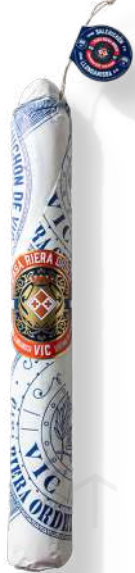
ref.2362,2 LLONGANISSA CULAR DE VIC RIERA ORDEIX (±1,1kg. x 2u.)