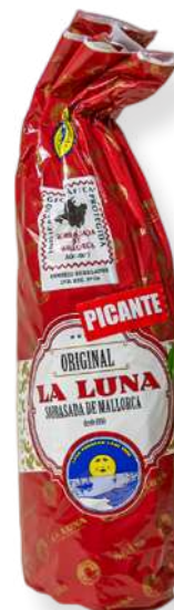
ref.2804 SOBRASSADA PICANT LA LUNA(±500gr. x 6kg.)