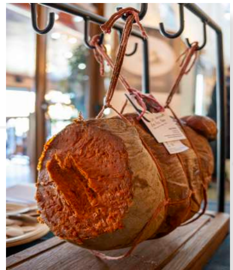
ref.2830 SOBRASSADA DE VENTRE ARTESANAL SELECTA XESC REINA (± 8kg. x 1u.)