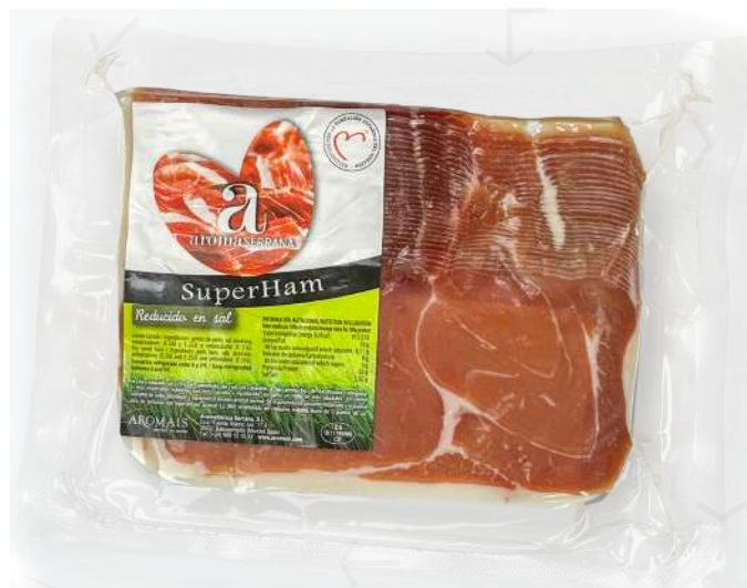
ref.2195 LLESQUES DE PERNIL AROMA SERRANA (500gr. x 10u.)