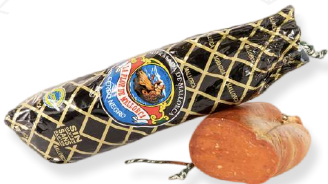
ref.2801 SOBRASSADA ARTESANAL SELECTA DE PORC NEGRE LA FLOR DE MALLORCA (± 800gr. x 3kg.)