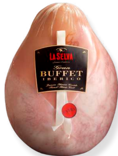
ref.2014 PERNIL CUIT EXTRA GRAN BUFFET IBÈRIC LA SELVA (7kg. x 1u.)