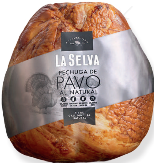
ref.2049 PIT DE DALL DINDI NATURAL BRASEJAT LA SELVA (3kg. x 1u.)