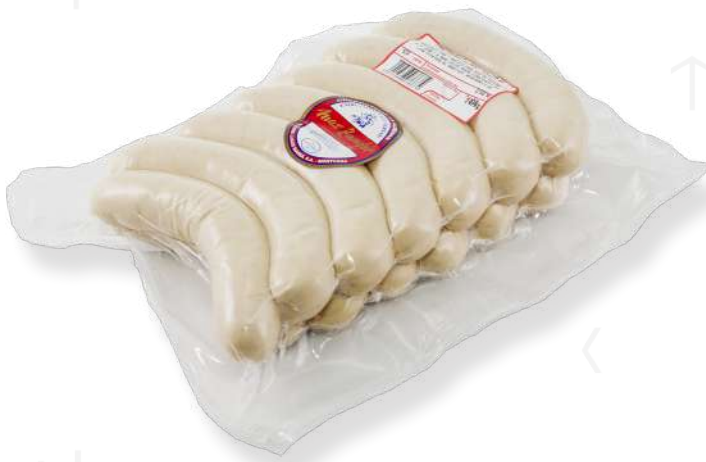
ref.2726 BRATWURST (13u.) MAX ZANDER (1,5kg. x 3u.)