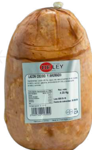
ref.2059,1 LACÓN CUIT I FUMAT DELEY (4,5kg. x 2u.)