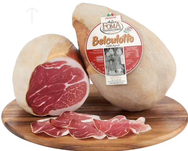
ref.2035,5 BELCULOTTO CULATA STAGIONATA ANTICA FOMA (5kg. x 1u.)