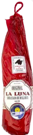
ref.2803 SOBRASSADA DOLÇA LA LUNA (±500gr. x 6kg.)