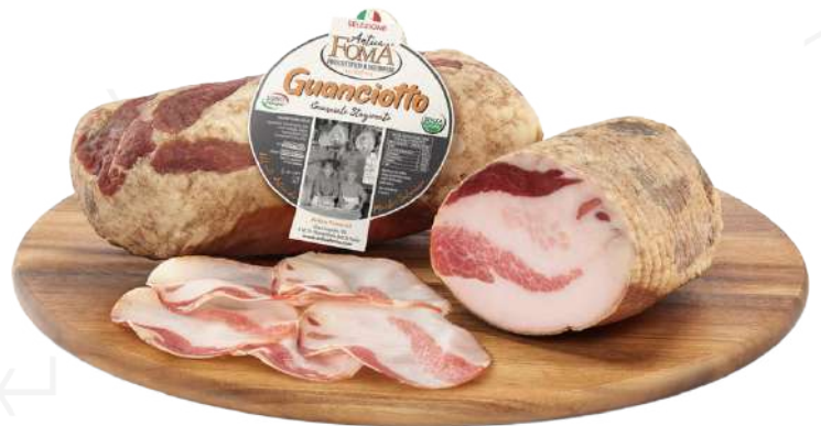
ref.2280,5 GUANCIOTTO ARREDOLATO CON PEPE ANTICA FOMA (2,5kg. x 1u.)