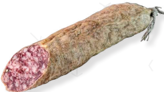
ref.2313 SALSITXO DE CAMPANYA SELECCIÓ LEONCIO (1kg. x 6u.)