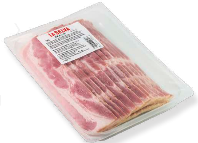
ref.2294 LLESQUES DE BACON LA SELVA (500gr. x 4u.)