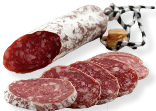
ref.2378 FUET ESPETEC DELEY (±170gr. x 16u.)