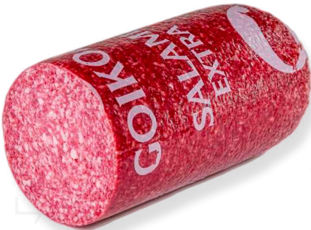
ref.2396 SALAMI EXTRA GOIKOA (4kg. x 1u.)