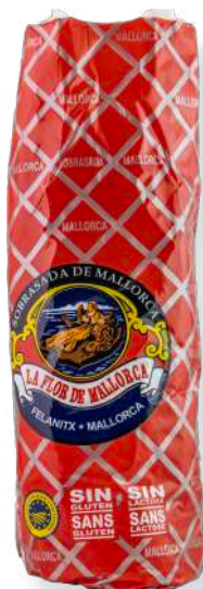
ref.2811 SOBRASSADA ARTESANAL SELECTA PICANT LA FLOR DE MALLORCA (± 800gr. x 3kg.)