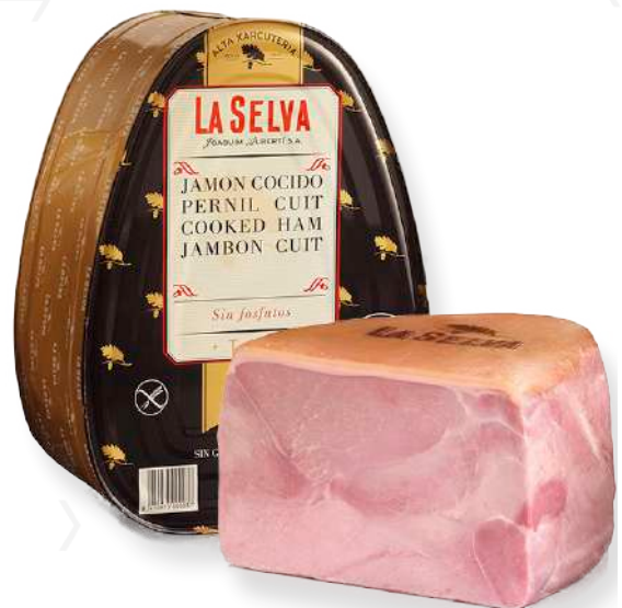
ref.2017 PERNIL CUIT EXTRA LLAUNA S/FOSFATS LA SELVA (8kg. x 2u.)