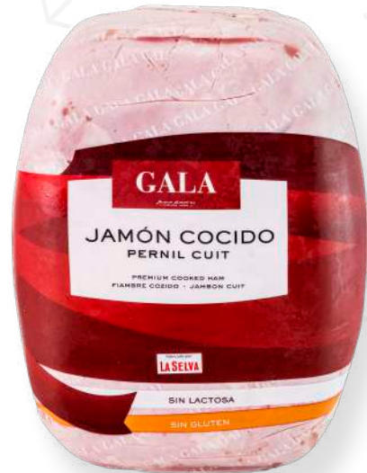
ref.2040 PERNIL CUIT EXTRA GALA LA SELVA (6,5kg. x 1u.)