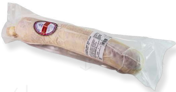
ref.2215 CATALANA CULAR SANT ROC MAX ZANDER (1kg. x 3u.)