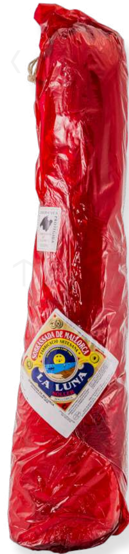
ref.2805 SOBRASSADA CULAR SUPERIOR LA LUNA (2,5kg. x 10kg.)