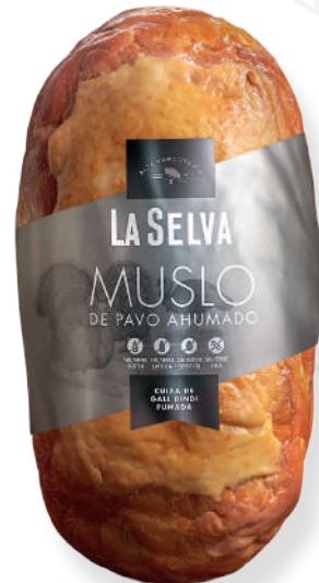
ref.2055 CUIXA DE GALL DINDI LA SELVA (2,2kg. x 1u.)