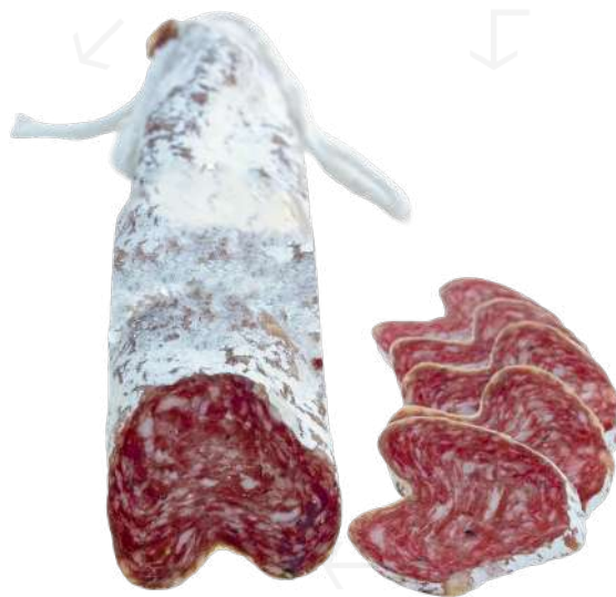
ref.2378,1 LLONGANISSA DE PAGES DELEY (±650gr. x12u.)