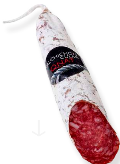
ref.2330 SALSITXÓ CULAR QNAT (1,5kg. x 2u.)