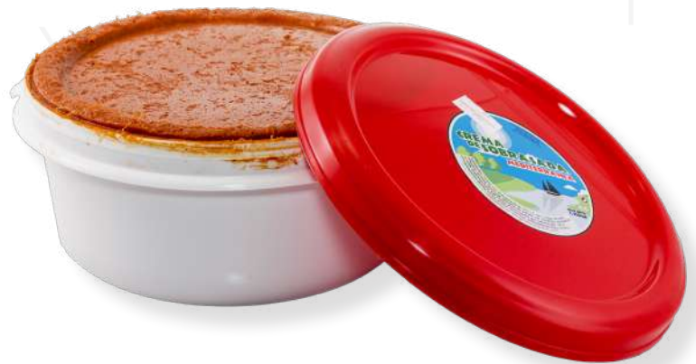
ref.2820 CREMA DE SOBRASSADA ES PAGES (3kg. x 2u.)