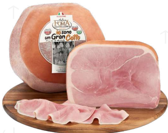
ref.2037 PROSCIUTTO GRAN COTTO ANTICA FOMA (9kg. x 1u.)