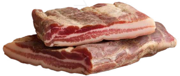
ref.2286 VENTRESCA S/PEBRE LA SELVA (2kg. x 3u.)