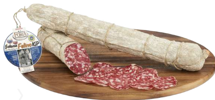
ref.2402,5 SALAME FELINO I.G.P. ANTICA FOMA (1kg. x 1u.)