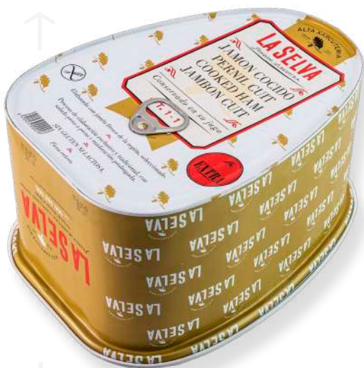
ref.2016 PERNIL CUIT EXTRA LLAUNA LA SELVA (8kg. x 2u.)