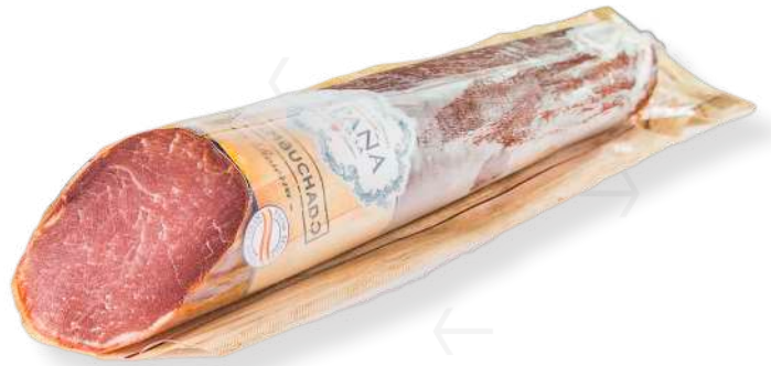
ref.2514 LLOM GRAN RVA. 1/2PEÇA ESPAÑA (800gr. x 9u.)