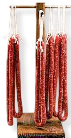
ref.2377,1 FUET SECALLONA EXTRA RIERA ORDEIX (±200gr. x 20u.)