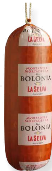
ref.2230 MORTADEL·LA BOLONIA LA SELVA (3,5kg. x 1u.)