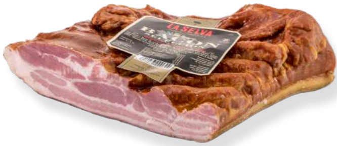
ref.2292,2 GRAN BACON SELECCIÓ 1/2 PEÇA LA SELVA (1,5kg. x 4u.)