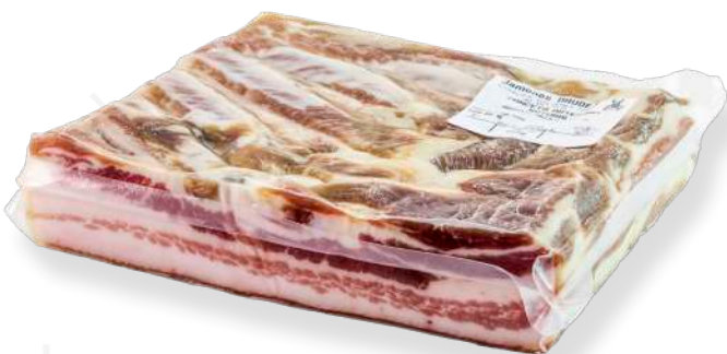
ref.2292 BACON CURAT TEROL DAUDEN (1,2kg. x 4u.)