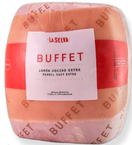
ref.2030 PERNIL CUIT EXTRA BUFFET LA SELVA (7kg. x 1u.)