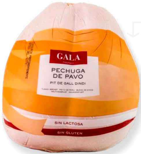
ref.2056 PIT DE DALL DINDI GALA LA SELVA (3,5kg. x 1u.)