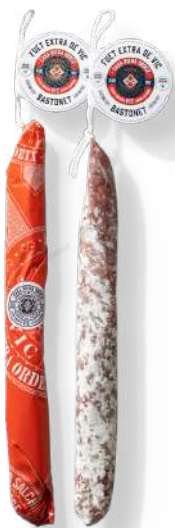
ref.2377 FUET EXTRA BASTONET DE VIC RIERA ORDEIX (±200gr. x 16u.)