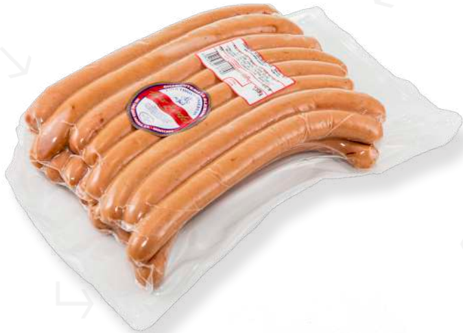
ref.2715 FRANKFURT HEIDELBERG LLARG MAX ZANDER (1,2kg. x 5u.)