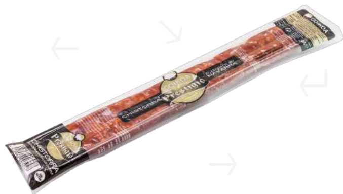
ref.2441 XISTORRA INDIVIDUAL GOIKOA (200gr. x 15u.)