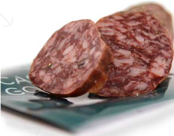
ref.2316 SALSITXO IBÈRIC DE GLÀ CASTRO & GONZALEZ (1kg. x 6u.)