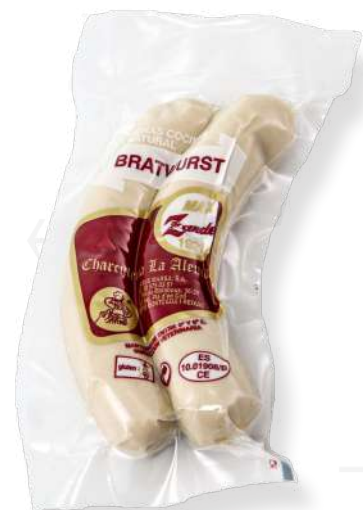
ref.2726 BRATWURST (2u.) MAX ZANDER (200gr. x 25u.)