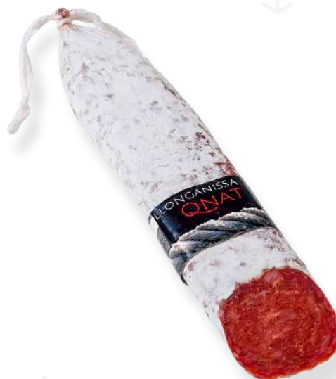
ref.2365 LLONGANISSA PAGES QNAT (500gr. x 4u.)