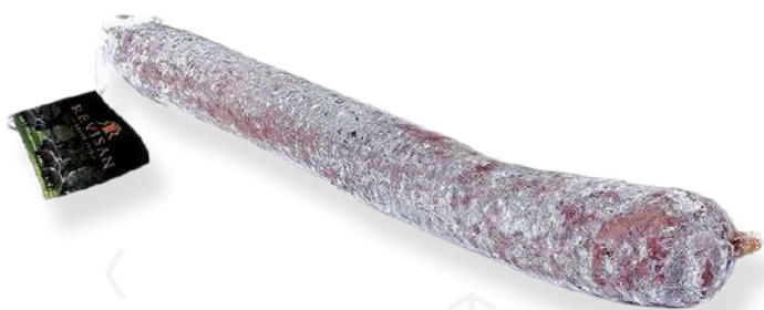
ref.2314 SALSITXO IBÈRIC CULAR "CEBO" REVISAN (1,2gr. x 8u.)