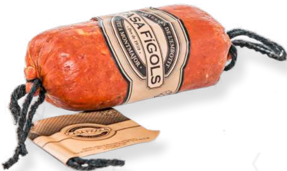
ref.2824 SOBRASSADA AMB FORMATGE I MEL CASA FIGOLS (± 240gr. x 12u.)