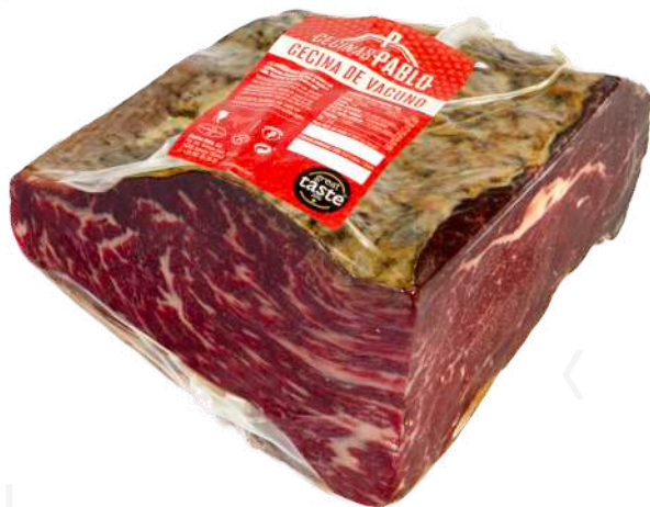
ref.2192 CECINA DE LEON TACS PABLO (1kg. x 8u.)