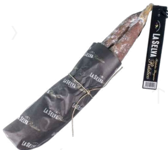
ref.2364 LLONGANISSA RUSTICA LA SELVA (0,65kg. x 2u.)