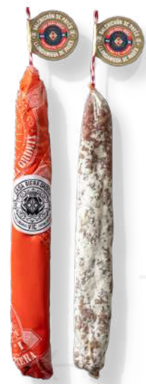
ref.2362,1 LLONGANISSA DE PAGES DE VIC RIERA ORDEIX (±500gr. x 2u.)