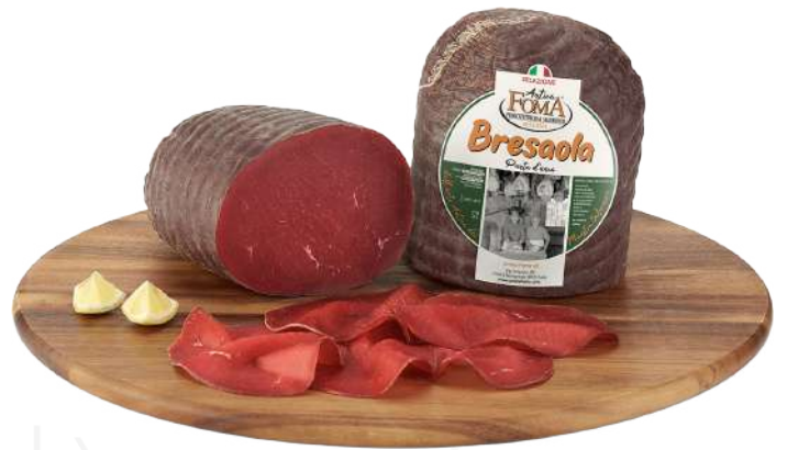
ref.2139,9 BREASOLA ALTA QUALITA ANTICA FOMA (2kg. x u.)