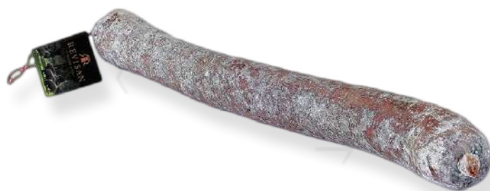
ref.2314 XORIÇ IBÈRIC CULAR "CEBO" REVISAN (1,2gr. x 8u.)