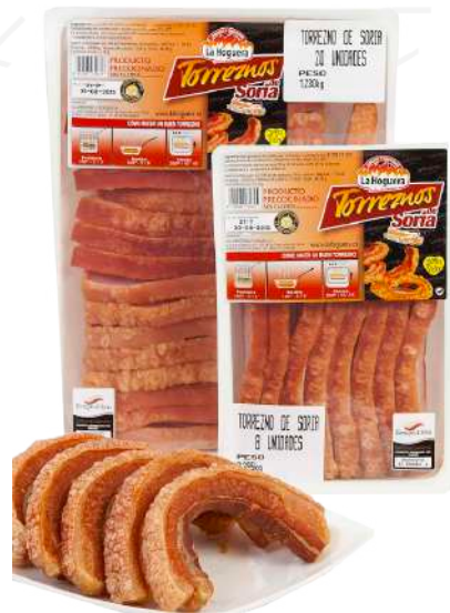
ref.2285 TORREZNO PRECUINAT LA HOGUERA (1,5kg. x 5u.)