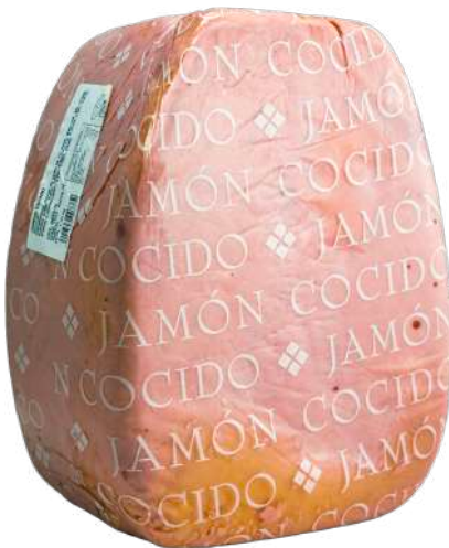
ref.2046 PERNIL CUIT EXTRA DELEY (7kg. x 2u.)