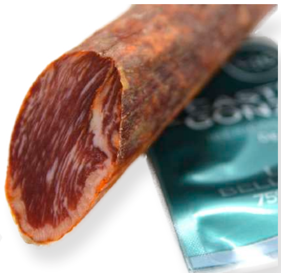
ref.2503 LLOM IBERIC DE GLÀ CASTRO&GONZALEZ (1kg. x 6u.)