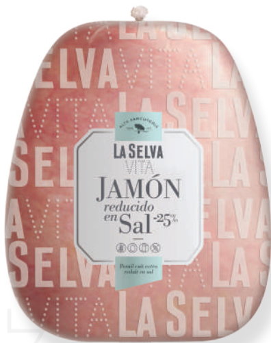
ref.2012 PERNIL CUIT EXTRA VITA(25%- SAL) LA SELVA (6,8kg. x 1u.)